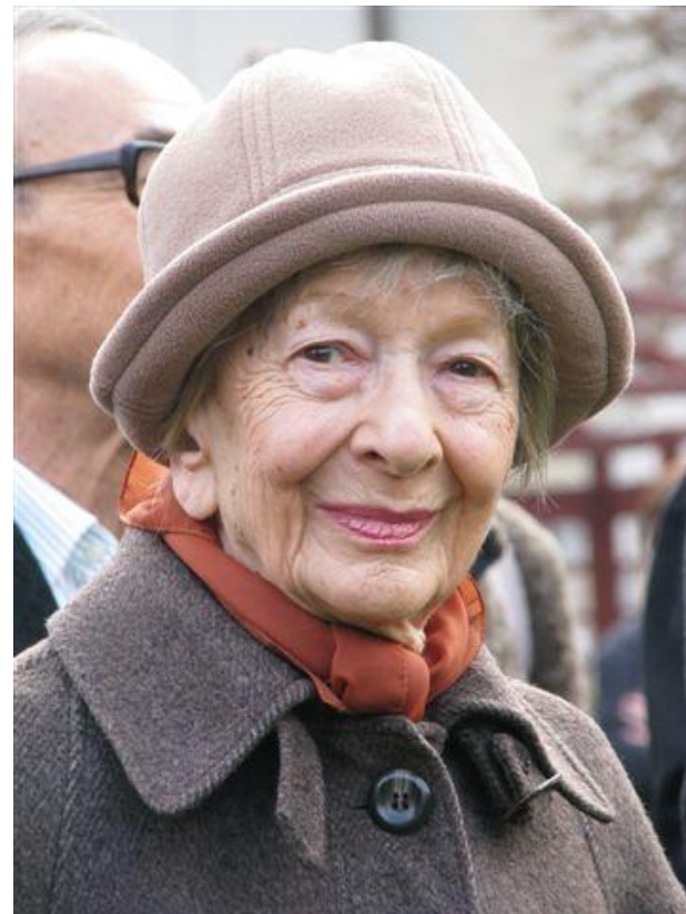
Mariusz Kubik, CC BY 3.0 < https://creativecommons.org/licenses/by/3.0/ >, Wikimedia Commons