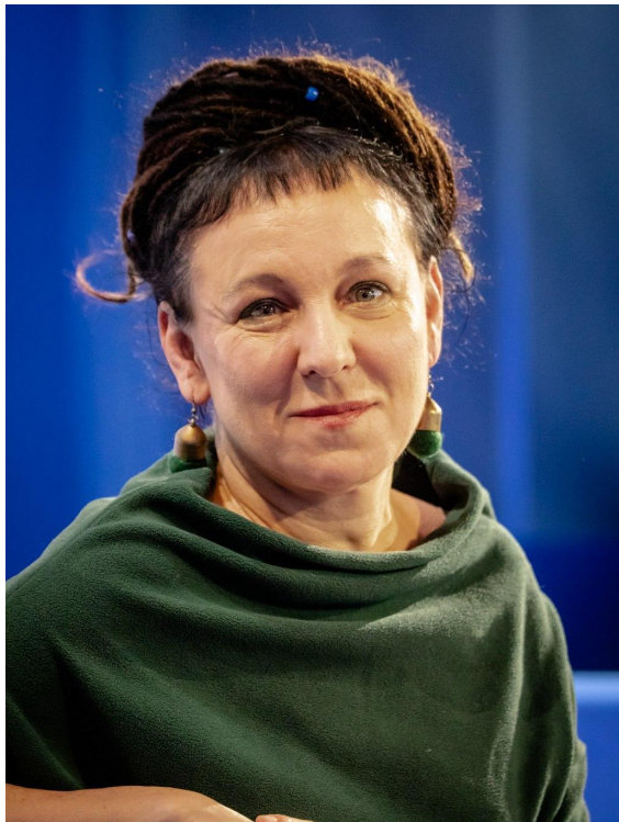
Harald Krichel, CC BY-SA 4.0 < https://creativecommons.org/licenses/by-sa/4.0/ >, Wikimedia Commons