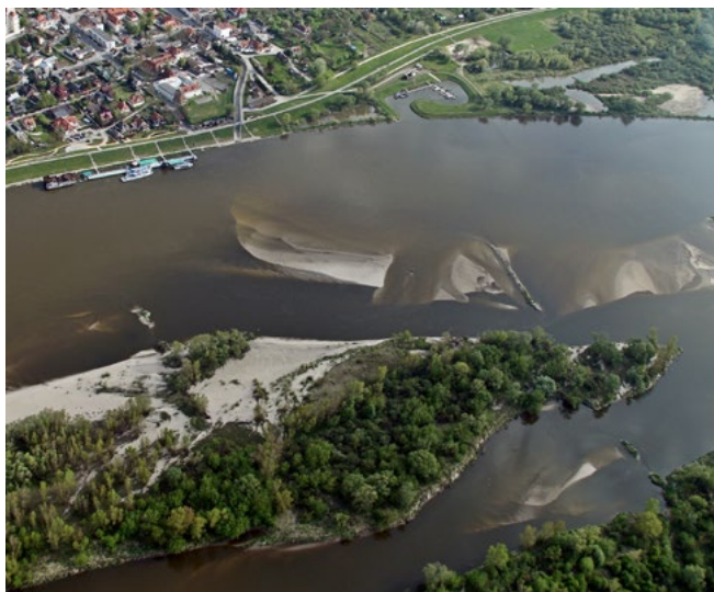
Małopolski Przełom Wisły