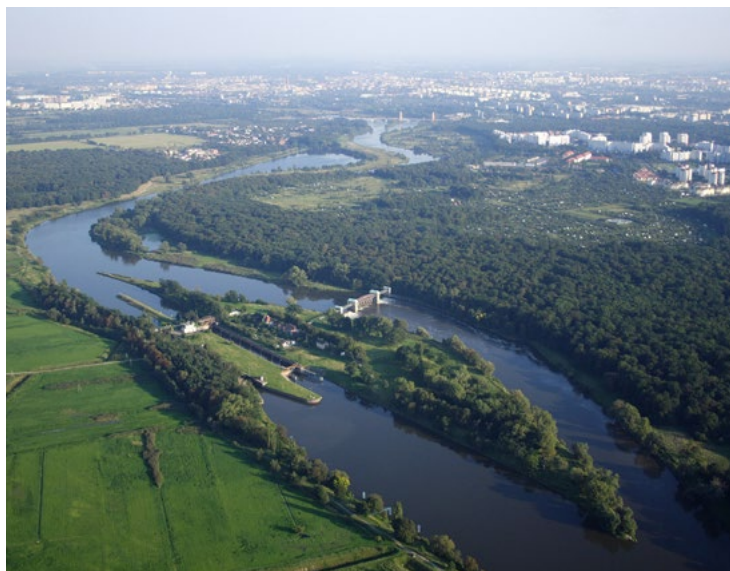
Wyspa Rędzińska na Odrze we Wrocławiu