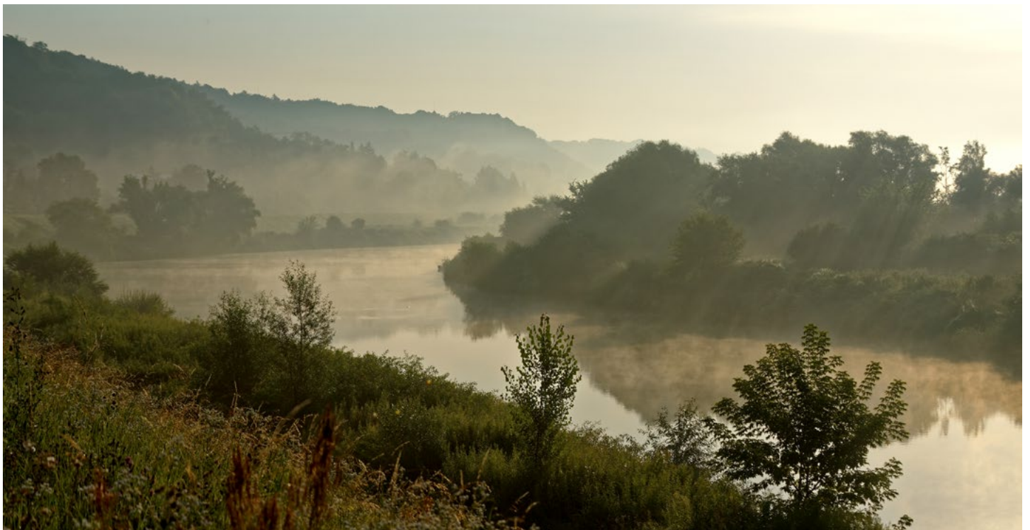
► Poranna mgła nad Wisłą w Krakowie

Wisło szara, nie zamieniłbym cię na dumną Tamizę, ani zawrotną Niagarę, ani tajemniczą Zambezi ani magiczny Ganges. Tamte może stokroć piękniejsze, mówiłyby do mnie językiem, którego nie rozumiem. Wisło szara, kocham twe brzegi, porośnię krzywą wierzbina, która przegląda się w twych nurtach, kocham twe piaski i gwiazdy, które kapią się w twych wodach