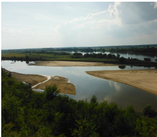
Krowia Wyspa na Wiśle w Kazimierzu Dolnym