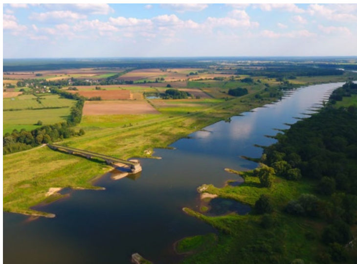
Dolina Środkowej Odry, Krośnieńska Dolina Odry